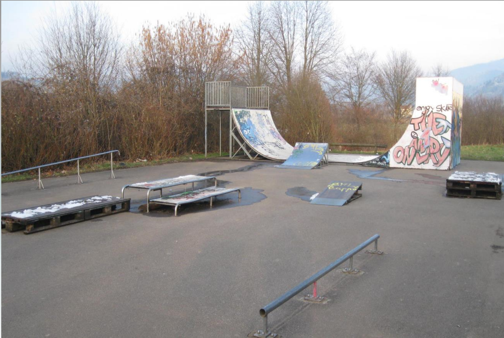
Erstes großes Projekt: Skaterplatz - seit 1997