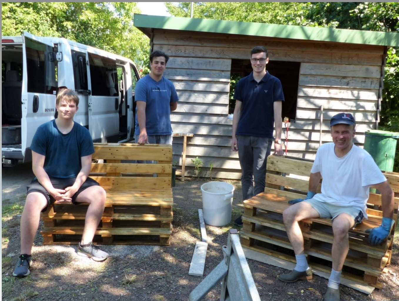
Aufstellen von Palettenbänken an der Grillstelle am überdachten Treffpunkt am 14.07.2020