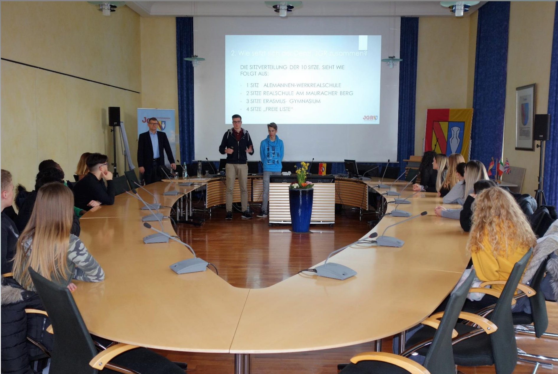
Mitwirkung bei den Infoveranstaltungen für Erstwähler/innen im Frühjahr 2019