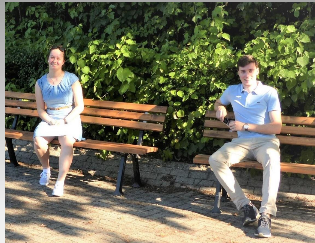
Aufstellen von Bänken im Leichtathletikstadion 2020