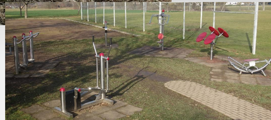
Mehrzweckplatz am Waldkindergarten am Einbollen am 2.04.2020