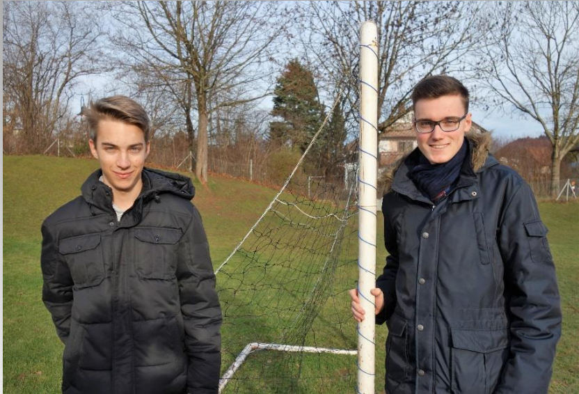
Anbringung neuer Netze am Bolzplatz „Heidach“ 2019