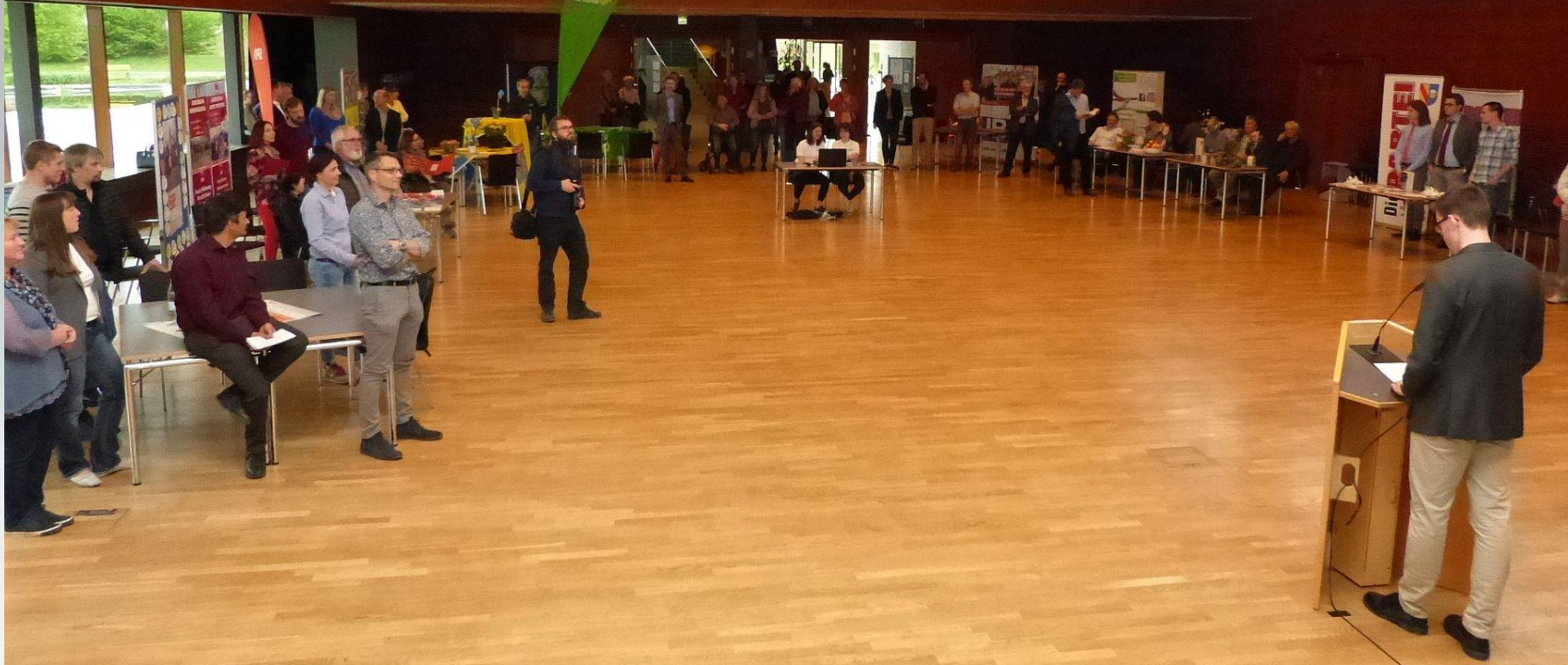
Vorstellung der Kandidaten zur Gemeinderatswahl am 29.04.2019 im KuB