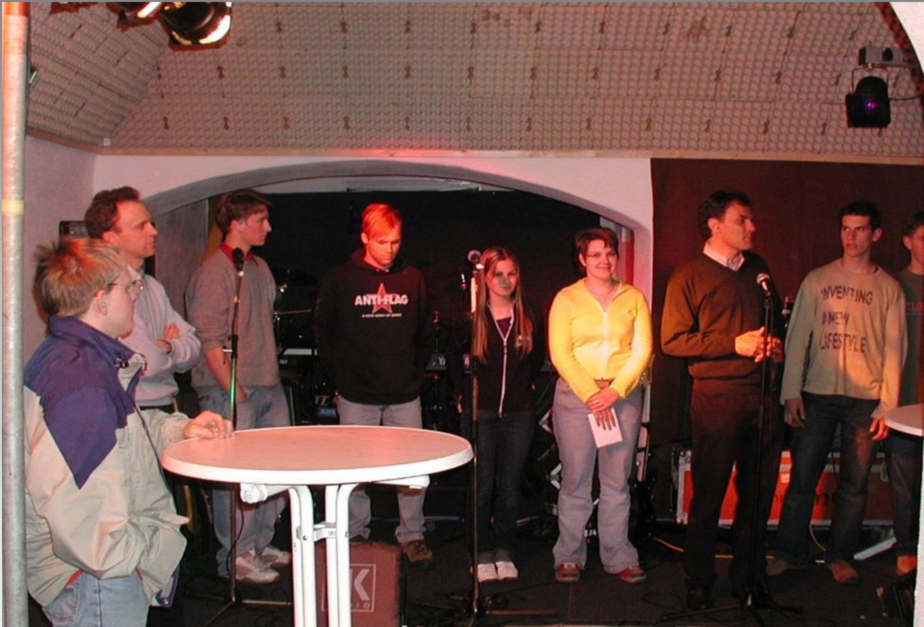
Teuerstes Projekt: Bandproberaum im Otto-Raup-Keller (Hauptstr. 124) seit 2004