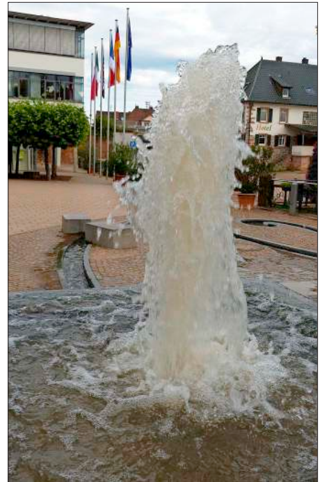
Die Wasserfontäne auf dem Rathausplatz entsteht ohne Pumpe aufgrund des natürlichen Gefälles.

Von dort aus fließt es dann in einem serpentinartig angelegten kleinen Kanal auf dem Rathausplatz in den Dorfbach. Unser Bild entstand vorletzten Woche am Donnerstag, als die Fontäne nach starken Regenfällen fast ein Meter hoch war.