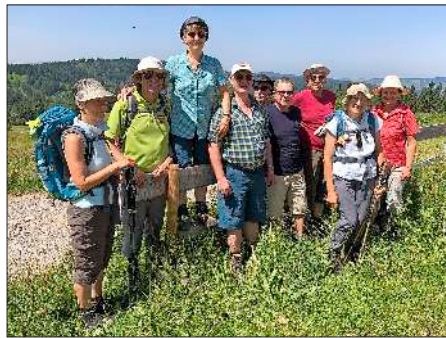
Zehn Wanderer trotzten der Hitze und wurden mit tollen Ausblicken belohnt.

Für an Krebs erkrankte Menschen und ihre Angehörigen bietet die Psychosoziale Krebsberatung Freiburg jeden zweiten Donnerstag im Monat eine Beratung im Kreiskrankenhaus Emmendingen an. Am Donnerstag, 11. Juli geht es um die möglichen psychischen Herausforderungen, die bei der Diagnose Krebs entstehen können. Zudem werden unterschiedliche Wege beleuchtet, mit dieser Belastung umzugehen. Beginn ist um 14 Uhr im Nebengebäude des Kreiskrankenhauses (Haus C) im Vortragsraum U 1 im Erdgeschoss. Im Anschluss daran werden Fragen beantwortet sowie Einzelberatung angeboten.