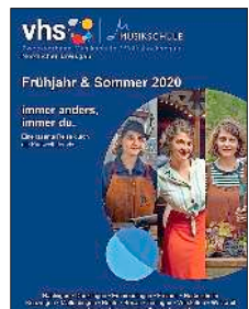
Mit 140 Seiten ist das neue Programmheft so umfangreich wie noch nie.