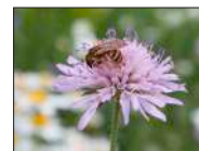
Gelbbinde Furchenbiene in Denzlingen, NABU Marquardt

Liebe Mitbürgerinnen und Mitbürger, duftende Kräuter, süßes Obst oder knackiges Gemüse, eingebettet in naturnahe Blumen- und Staudenbepflanzung lassen sich auch auf beengtem Raum realisieren. Zahlreiche Insekten freuen sich über die blühende Vielfalt. Die Gemeinde Denzlingen lädt alle Interessierten zu einer Informationsveranstaltung „Insektensterben! Was können wir zu Hause tun?“ am Freitag, 27. März, von 16 bis 18 Uhr und am Samstag, 28. März, von 10 bis 12 Uhr ein. Treffpunkt: Bauhof Denzlingen, Eisenbahnstraße 14. Kommen Sie vorbei! Sie erhalten zahlreiche fachmännische Tipps und Anregungen, wie Sie ihren eigenen Garten oder den heimischen Balkon naturnah gestalten und in eine blühende Oase verwandeln können. Wir bitten um Anmeldung beim Bauhof Denzlingen, Telefon 07666 / 611-513, bis spätestens 23.03.2020. Die Teilnahme ist kostenfrei.