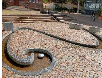
Das Dorfbachwasser fließt nach einigen Schlangenkurven auf dem Rathausplatz zurück in den Bach.

Denzlingen (hg). Eine beliebte Attraktion nicht nur für Kinder ist die kleine Fontäne auf dem Denzlinger Rathausplatz. Bei der Gestaltung des Rathausplatzes hat man bereits vor bald 30 Jahren ein belebendes Element zu realisiert, das von der Bevölkerung gerne angenommen wird.