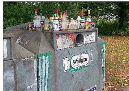
Standort Hachberger Straße

Zur Entsorgung von Altglas gibt es im Gemeindegebiet zahlreiche Standorte, an denen entsprechende Container aufgestellt wurden. In letzter Zeit kam es auffällig oft dazu, dass die Container völlig überfüllt waren und einen un schönen Anblick boten.